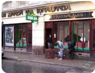
Театр юного глядача