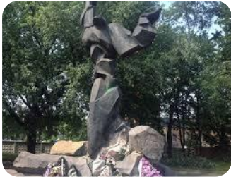
Пам'ятник жертвам Голокосту

Одним із зразків проблемної спадщини Львова є пам'ятник жертвам Голокосту (щоправда, про нього згадали лише гіді!). Він є фрагментом незручної для українців спільної спадщини. Тож з одного боку, гіді визнають неправоту українців, а з іншого – намагаються показати, що не усі українці прагнули зла євреям.