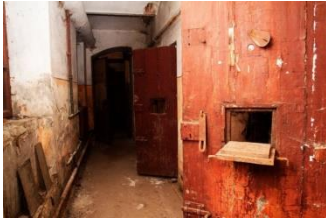
Музей-тюрма на Лонцького