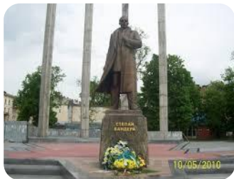
Пам'ятник Степану Бандері

Часто такими прикладами стають пам'ятники, присвячені героям українського національно-визвольного руху. З висловлювань експертів (-ок) бачимо, що пам'ятник Степану Бандері у Львові є дразливим не тільки для поляків, але й для частини українців. У роботі з цим фрагментом спадщини частина аудиторії намагається довести правоту С.Бандери, частина – просто відзначає суперечливість цієї фігури. Ще частина – засуджує пам'ятник у такому форматі за спробу банального «маркування» території.