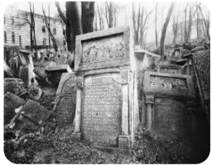
Єврейський цвинтар Львів

Експерт(к)и називали також місця спільної спадщини, які не є вшановані належним чином і постійно перебувають в зоні ризику знищення.