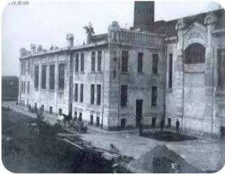
Львівська ТЕЦ 1

Одинично на групах було згадано, що промислові об'єкти також можуть бути позитивним кейсом спільної спадщини.