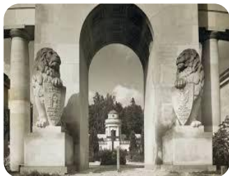
Леви з меморіалу Орлят